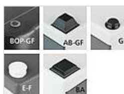
Универсальные резиновые ножки

22009000 GF полиуретан, твёрдость по Шору 65-75 чёрный