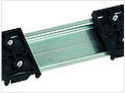
Универсальный держатель несущей шины TSH 35-2, полиамид 20035000 TSH 35-2 Черный янтарь, похоже на RAL 9005