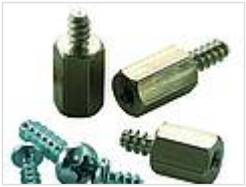
Винты (SHR) и распорные элементы (DIBLZ) для упоров в пластмассовых корпусах 59006986 DIBLZ AK 30x5/1M3/10 ND = 2,4-2,6, длиной 10mm, SW 5,5