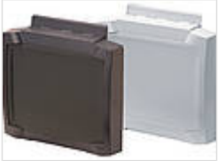
Передняя крышка на шарнирах с поверхностью для плёночной клавиатуры 20201535 BCD 200 OT-FSC-7035 Светло-серый 20201524 BCD 200 OT-FSC-7024 графитовый серый