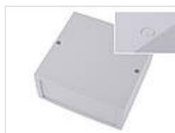
Накладки на винты