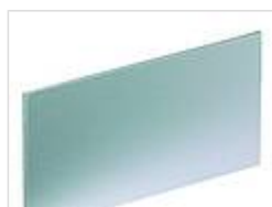
Фронтальные панели, алюминий