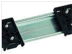
Универсальный держатель несущей шины TSH 35-2, полиамид 20035000 TSH 35-2 Черный янтарь, похоже на RAL 9005