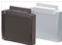
Передняя крышка на шарнирах с поверхностью для плёночной клавиатуры 20201535 BCD 200 OT-FSC-7035 Светло-серый 20201524 BCD 200 OT-FSC-7024 графитовый серый