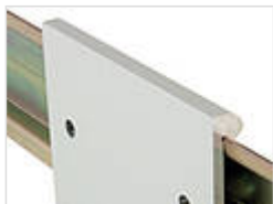
Металлический адаптер для DIN-рейки DIN EN 60715 TH 35

22035000 TSH 35 Черный янтарь, похоже на RAL 9005