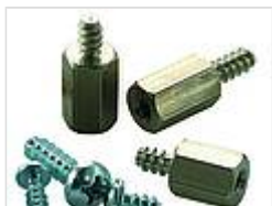
Винты (SHR) и распорные элементы (DIBLZ) для упоров в пластмассовых корпусах

35800300 BOP-GF полиуретан, твёрдость по Шору 65-75 Прозрачный