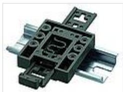
Универсальный держатель несущей шины TSH 35, полиамид

22009000 GF полиуретан, твёрдость по Шору 65-75 чёрный