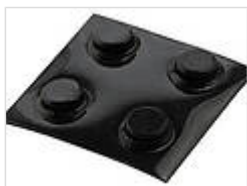
Резиновые ножки, самоклеющиеся

22009000 GF полиуретан, твёрдость по Шору 65-75 чёрный