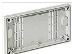
Прикрывающие крышки для ключевидного отверстия