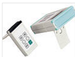
Универсальный зажим для установки и крепления