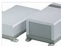
Настенные накладки, АБС