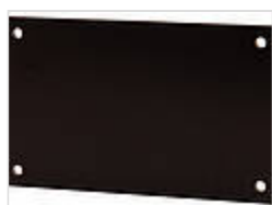
Монтажные платы, бумаголит