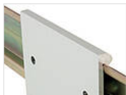
Металлический адаптер для DIN-рейки DIN EN 60715 TH 35