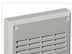
Крышки прикрытие винтов, АБС